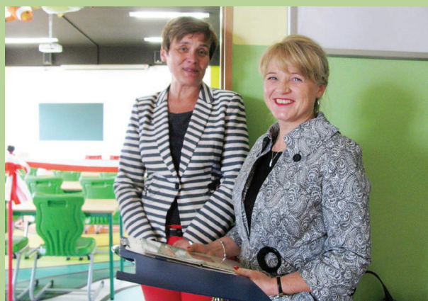
ZDJĘCIA WOJEWÓDZKIEGO FUNDUSZU W KATOWICACH