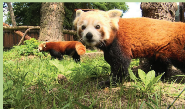
OZDOBĄ ZOO SĄ DWIE PANDY CZERWONE, PING I PONG. PRZYJECHAŁY ONE Z FRANCJI PRZESZŁO DWA LATA TEMU

Pierwsza ścieżka dydaktyczna w Śląskim Ogrodzie Zoologicznym w Chorzowie została wytyczona w 2007. Zaktualizowano ją w 2016, dzięki dofinansowaniu z WFOŚiGW. Teraz przyszła pora na kolejną aktualizację, także dzięki wsparciu Funduszu. Ścieżka w zoo wspiera proces edukacji przyrodniczej. Liczne tablice i plansze edukacyjne, a także drukowany przewodnik, regulują ruch zwiedzających i pomagają w samodzielnym zdobywaniu wiedzy. Fundusz udzielił niedawno dotacji w wysokości 30.650 zł na kolejną aktualizację ścieżki, która będzie polegała na wykonaniu i montażu 65 tablic gatunkowych, 35 tablic edukacyjnych, 65 tablic informacyjnych oraz opracowaniu i druku przewodnika, broszur i ulotek.