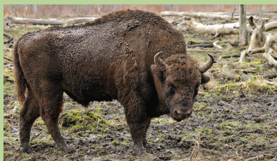
W PSZCZYNIE OD 1865 R. ZNAJDUJE SIĘ NAJDŁUŻEJ ISTNIEJĄCA ZAMKNIĘTA HODOWLA ŻUBRÓW NA ŚWIECIE

Zarząd WFOŚiGW w Katowicach udzielił ostatnio dotacji w wysokości ponad 37 tys. zł na zachowanie stada żubrów linii pszczyńskiej (imię każdego osobnika zaczyna się od liter PL) w Pokazowej Zagrodzie. Żubry należą do gatunku zagrożonego wyginięciem. W Europie jest ich ok. 4,5 tys., z czego w Polsce 1400. Żeby gatunek przestał być zagrożony, powinno ich być 10 tys. W ramach dofinansowania hodowli kupione zostaną różnicowane, wysokiej jakości pasze, gwarantujące utrzymanie stada w dobrej kondycji. Żubry będą miały też zapewnioną opiekę weterynaryjną. Zwierzęta w parku pszczyńskim odżywiają się o tej porze roku sianem, marchwią, kukurydzą, mieszankami zbóż i otrębami pszennymi.