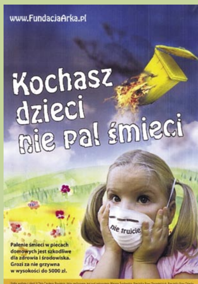
PLAKAT BIELSKIEJ FUNDACJI ARKA

WFOŚiGW w KATOWICACH rozstrzygnął II edycję konkursu dla gmin województwa śląskiego na realizację kampanii informacyjnych i edukacyjnych dotyczących gospodarki odpadami. Samorządy złożyły 20 wniosków.